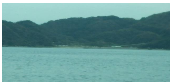
上関町長島 田ノ浦

*2019年2月4日14時から第1回控訴審が開かれることになりました。（編集部）