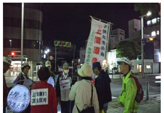
金曜ウォークで脱原発をアピール