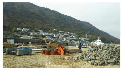
祝島港（工事中）11月25日撮影